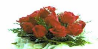
จัดดอกไม้