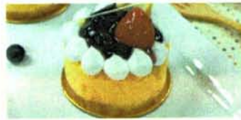
บลูเบอร์รี่ชีสเค้ก