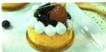
บลูเบอร์รี่ชีสเค้ก