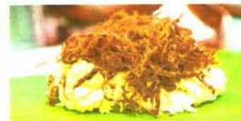
ข้าวเหนียวหมูฝอย