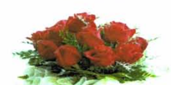
จัดดอกไม้