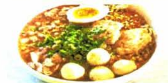
ก๋วยเตี๋ยวสุโขทัย