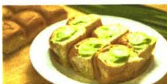
ขนมปังไส้ทะเล็ก