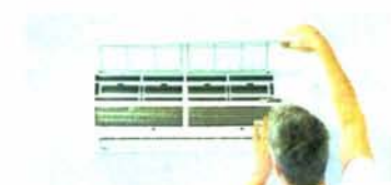
ช่อมแอร์