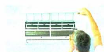
ช่อมแอร์