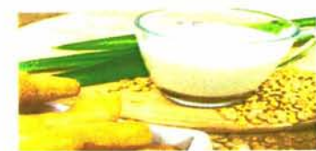
น้ำเต้าหู้/ปาฟองโก้