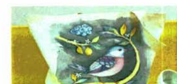
เพ้นท์กระเป่า