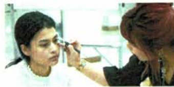
แต่งหน้า