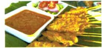
หมูสะเต๊ะ