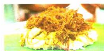
ข้าวเหนียวหมูฝอย