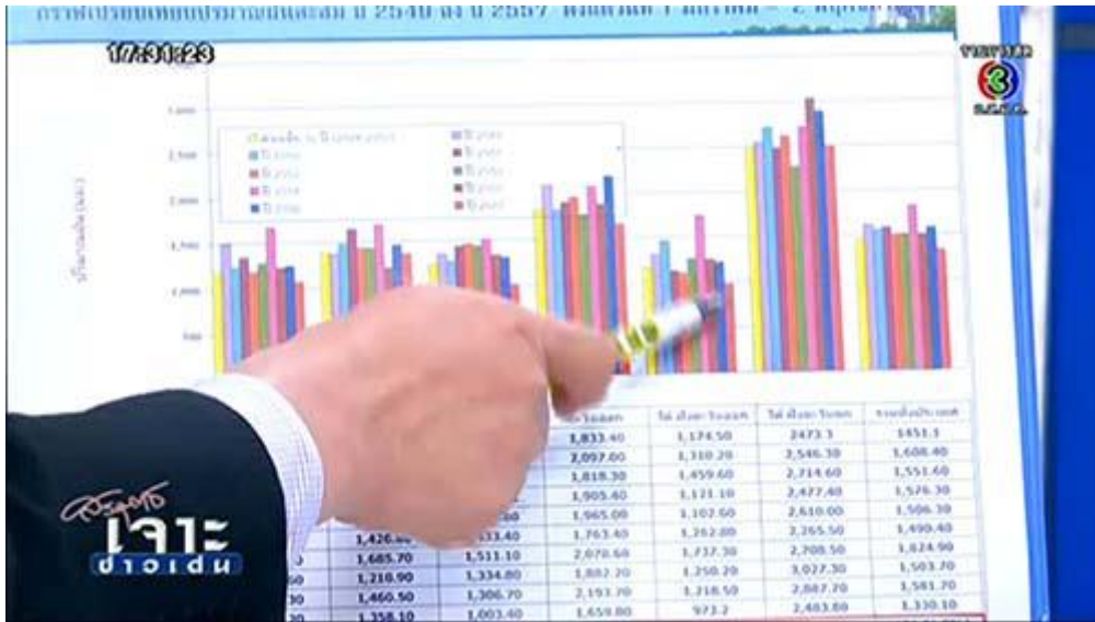
กราฟแสดงปริมาณน้ำฝนสะสมปีนี้ต่ำที่สุด

นายเลิศวิโรจน์ โกวัฒนะ อธิบดีกรมชลประทาน ระบุว่าระดับน้ำปีนี้อาจต่ำที่สุดในรอบ ๑๕ ปี เพราะฤดูฝนมาช้ากว่าจะถึงหน้าฝนก็ย่างเข้าเดือน ส.ค. ซึ่งหน้าฝนครั้งนี้มีน้ำเข้าเขื่อนน้อยกว่าระบายออก ทำให้น้ำในเขื่อนมีน้อย