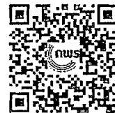
QR code สำหรับแจ้งจำนวน ผู้ได้บังคับบัญชา